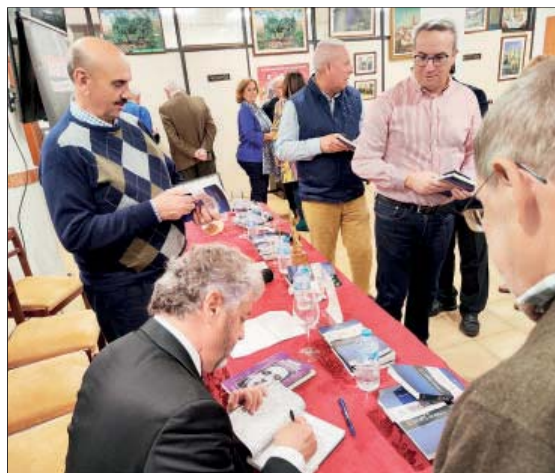
EN LA CASA. Mesa y público en la presentación. Firma de libros del autor y entrega de un pergamino conmemorativo del acto.