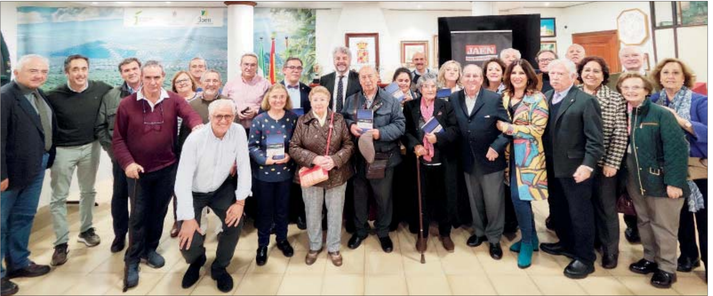
EL GRUPO DEL ENCUENTRO. Participantes en la presentación del libro, con el autor, en la sala principal de la Casa de Jaén en Sevilla, céntrica calle Francos.